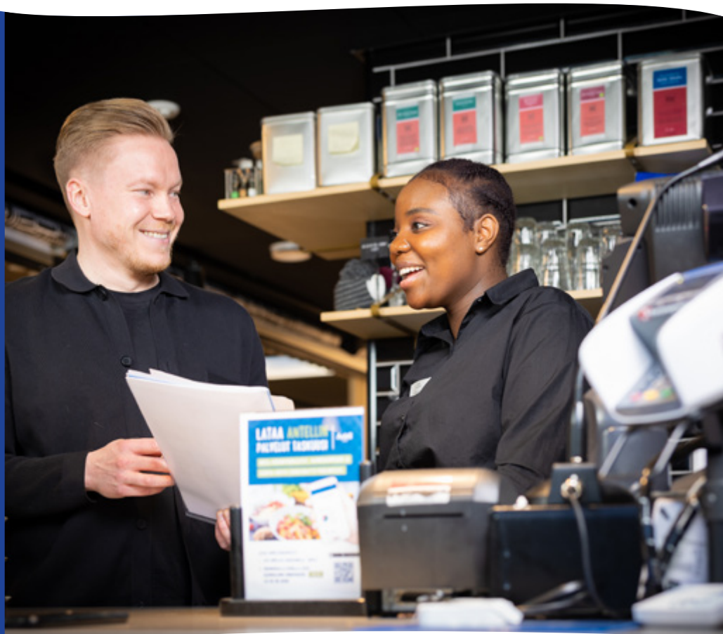
Graafinen suunnittelu ja painatus, Monetra Oulu Oy:n painatuspalvelut